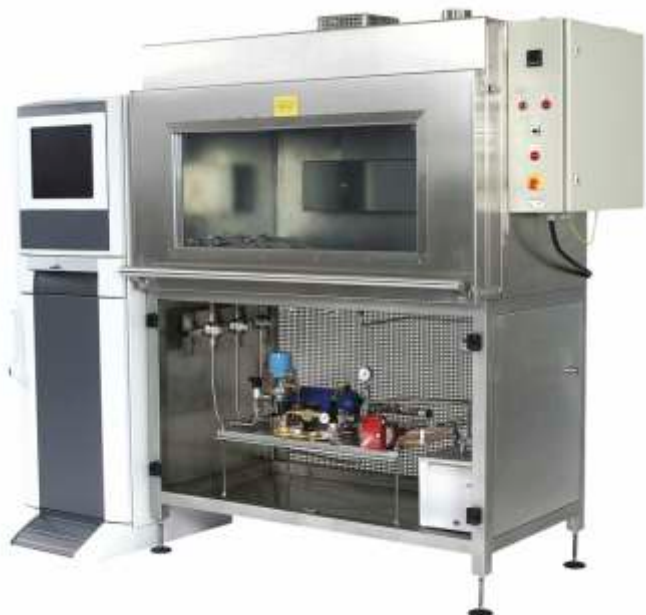
Стенд для проведения испытаний на разрыв - гидростатические испытания шлангов радиатора автомобиля