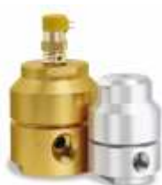
Угловой и сферический клапан с пневмоприводом серии VA и VG в положении ВКЛ/ВЫКЛ