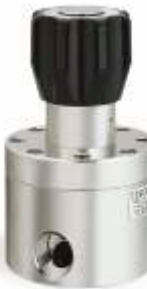
26-2500 Высокого расхода