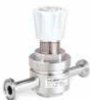
PH-3200 - средний расход