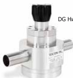
DG Низкого давления