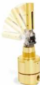
Угловой клапан серии VA, переключаемый рычагом