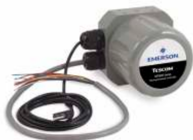
Цифровой регулятор давления ER5000