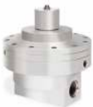
Объем максимального потока/низкое давление 20-1400