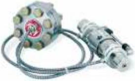
Устройство развязки с впаиваемой диафрагмой, 42 мВт (изображен с регулятором серии SJS)