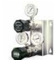
CS2200 Система переключения