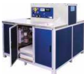
Испытательный стенд, под требования заказчика

Группа систем TESCOM проектирует и создает уникальные решения для регулирования давления и расхода. Компания предлагает стандартные конструкции и подстроенные под требования заказчика на уровне компонентов - преимущество, не встречающееся у других системных интеграторов.