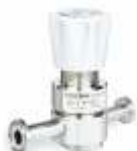
PH-2200 - низкий расход