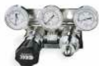
ACS012 Автоматический переключатель