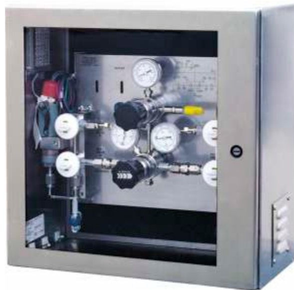
Автоматический преобразователь для работы с водородом под сверхвысоким давлением