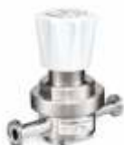
PH-2600 - низкий расход