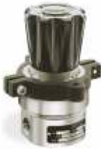
26-2300 Высокой точности