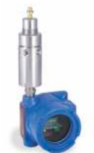
44-5800 Регулятор с электроподогревом