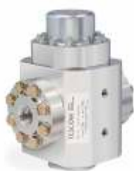
26-1200 Cv =12