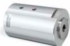
Встроенный клапан серии VLCV=10