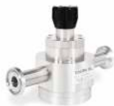
PH-1800 низкое давление и высокий расход

Все регуляторы Clean Pharmpure™ совместимы с продуктами BPE-2005 серий MJ и SF. Доступна возможность получения сертификата о функциональной чистоте.