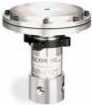
Пневмопривод (серии 26-2000)