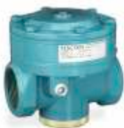
Регулятор низкого давления/большого расхода 269-529