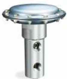
54-2800 Высокого расхода / Высокого давления